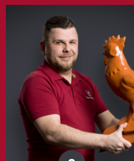
Olomoucký a Moravskoslezský kraj (+420) 603 402 868